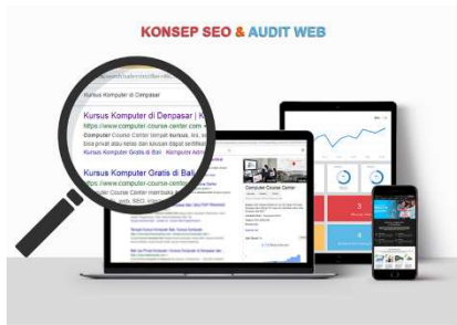
Proses Audit Website

Kursus SEO mengajarkan cara mengoptimalkan web agar bisa menempati posisi bagus di search engine secara organik dengan teknik White Hat.